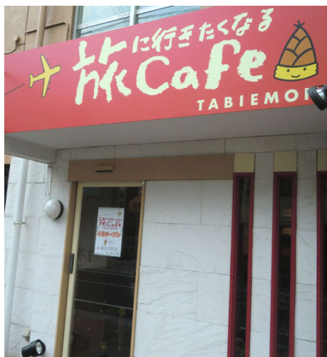
↑真っ赤な看板が目印です