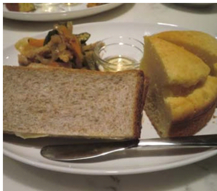
2種類のパンの味くらべが 嬉しいランチ・プレート♪