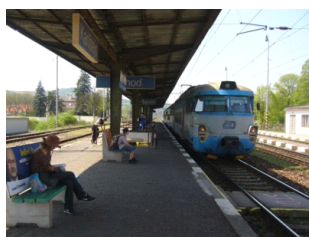
いざ、世界の車窓から♪