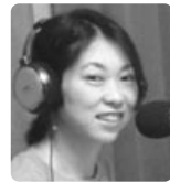
たびえもんの 日常を旅して 今さら 断捨離!の巻