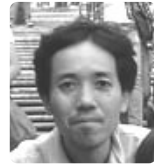
たびえもん 旅の思い出 学ぶの巻

たびえもん 旅の思い出 学ぶの巻 断捨離!の巻 たびえもんの 日常を旅して 今さら 断捨離!の巻 たびえもんの 日常を旅して 今さら 断捨離!の巻 たびえもんの 日常を旅して 今さら